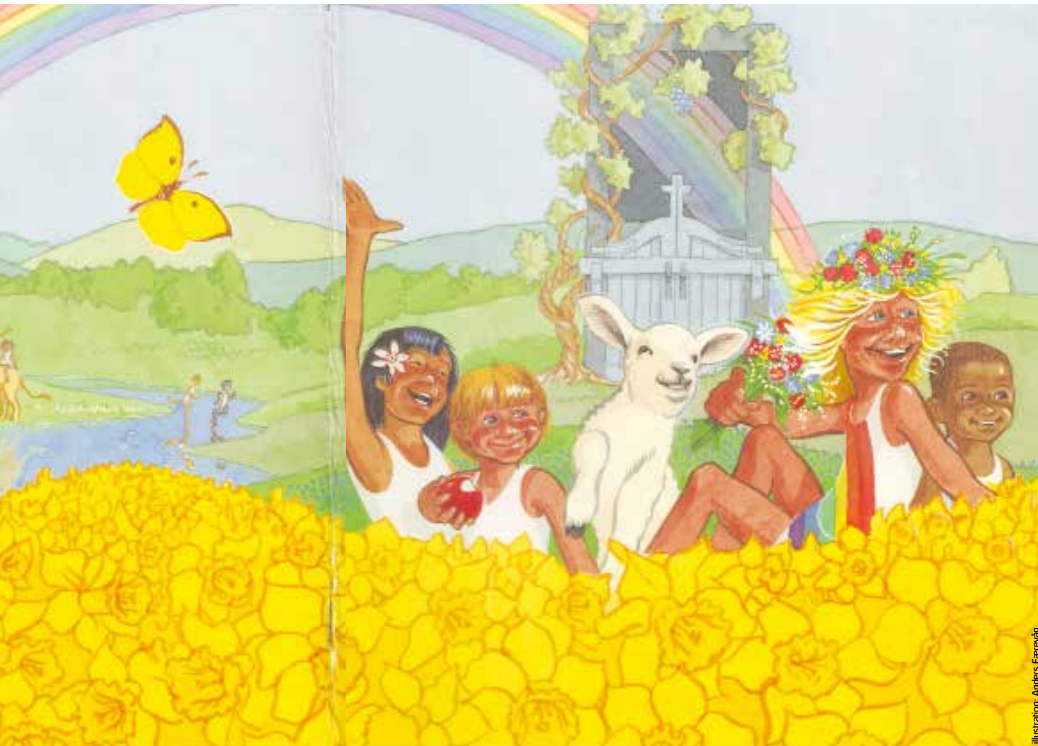
Illustration: Anders Færevåg

Anders Færevågs omslag til musicalen »Det Gode Land« viser hans forestilling af den evige herlighed.