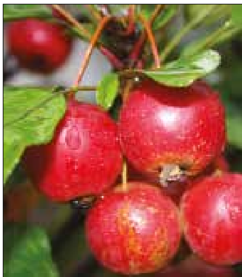
Luthers æbletræ har standset mange samtaler om Jesu genkomst

Og Jesu genkomst bliver så stor en omvæltning, at man lige så godt kan sige: »Selv om jeg vidste, at der vil falde en atom-bombe i min have i morgen, ville jeg alligevel plante mit æbletræ i dag.«