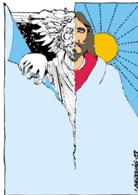
Tegning: Anders Færn

Forventning om Jesu genkomst hænger sammen med et ansvarligt liv her og nu.