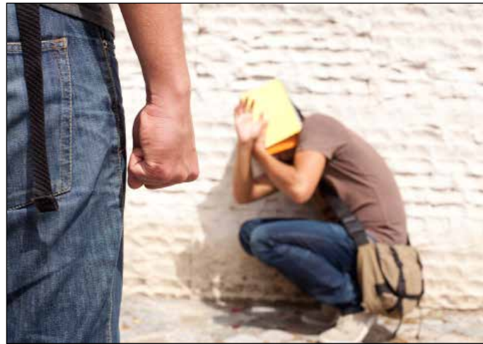
Gud har faktisk tænkt sig at gøre noget ved det onde i verden.

Hvad ligger der i ordene genfødselse, genoprettelse, befrielse? Se det i forhold til ondskaben i verden, i forhold til hele skaberværket og i forhold til jer selv.